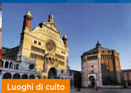
Luoghi di culto