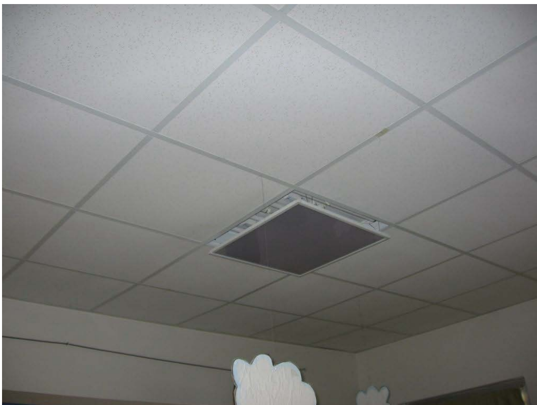
(3.1.2 V) Il controsoffitto non è realizzato con elementi in laterizio, né con elementi pesanti e fragili