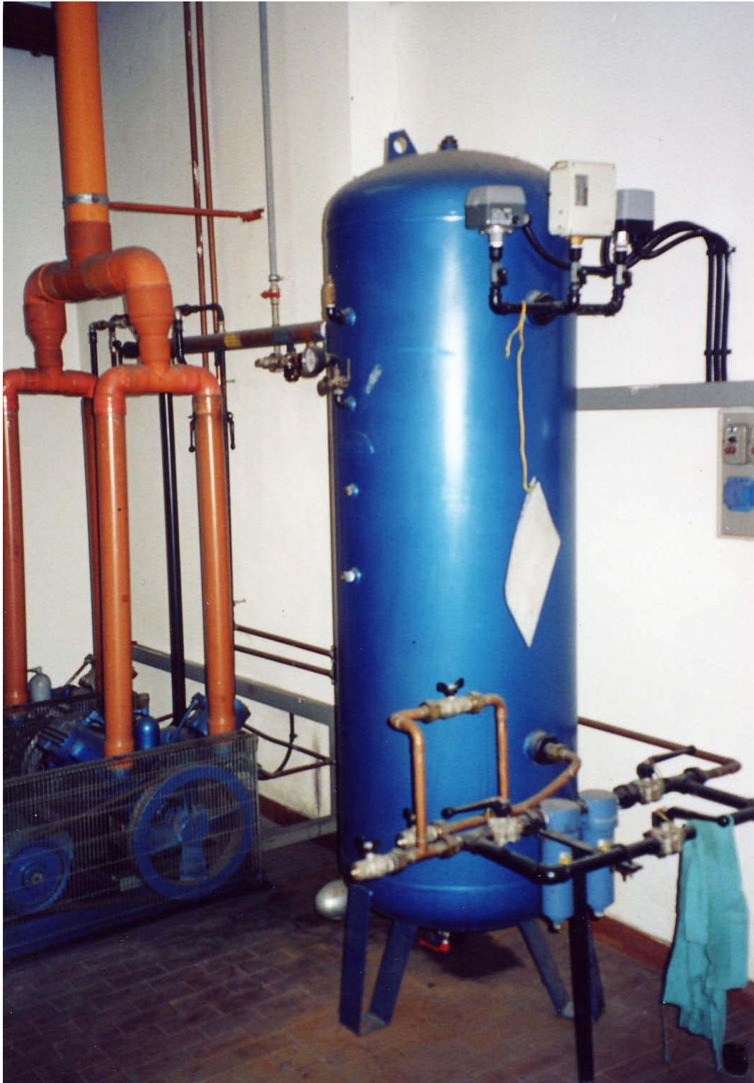
(3.5.2 F) L'apparecchiatura non appare adeguatamente ancorata alla struttura