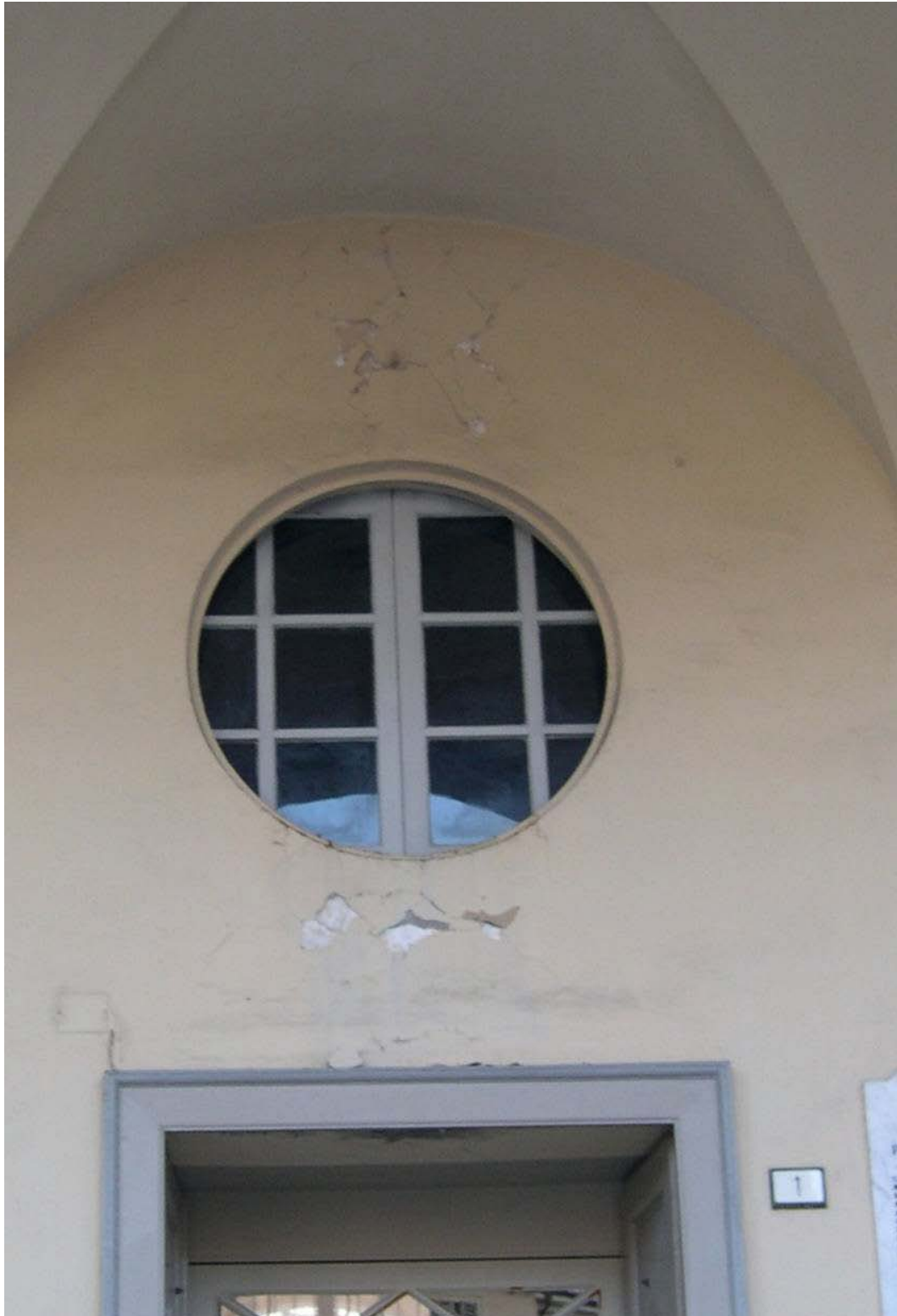
(3.2.4 F) L'intonaco al di sopra dell'uscita non è ben aderente alla muratura