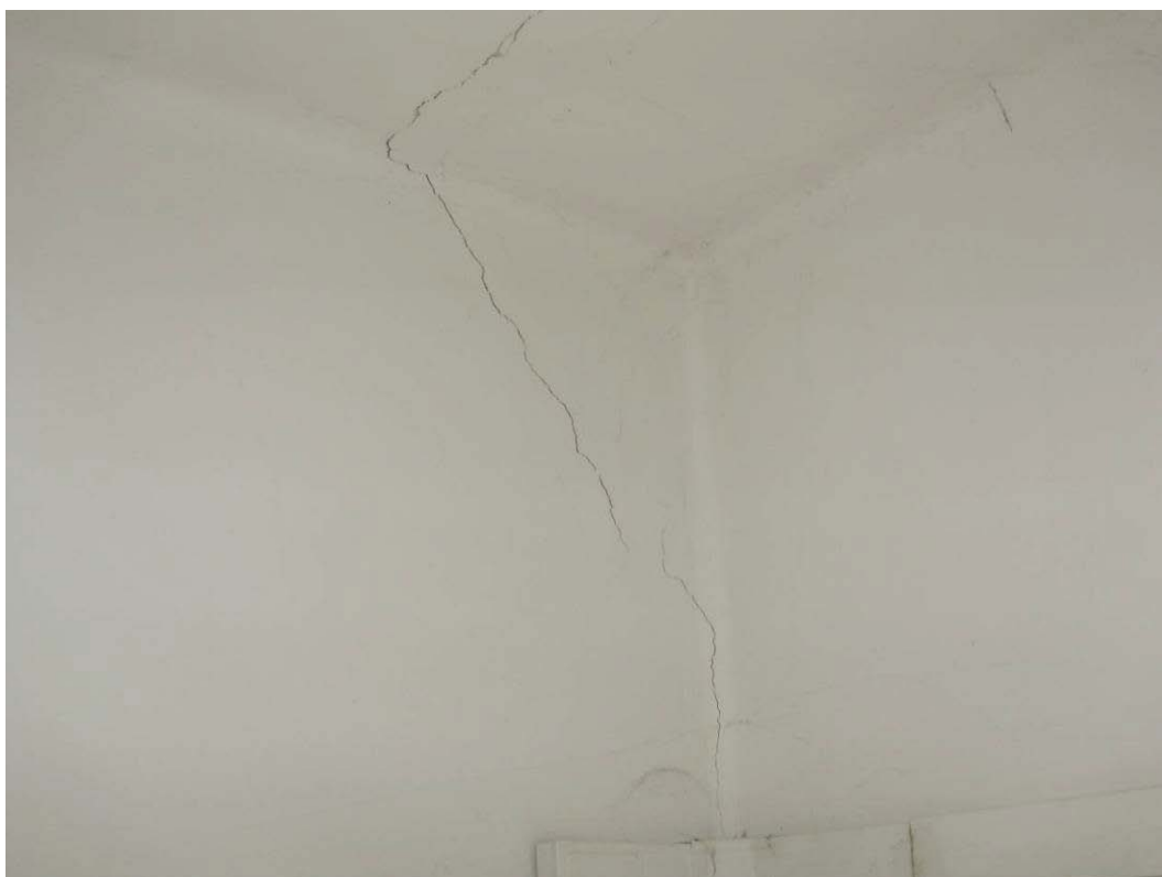
(3.1.1 F) Solaio in putrelle e tavelloni su parete in muratura con inizio di distacco di intonaco e danno strutturale