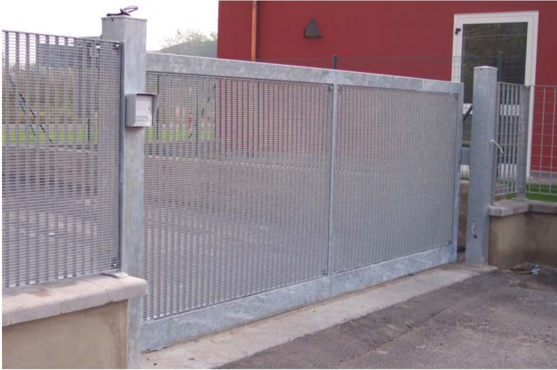
(3.4.3 V) Il cancello scorrevole dell'ingresso è in buono stato di manutenzione