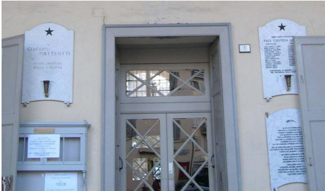
(3.2.4 V) Gli elementi in prossimità dell'uscita sono ben ancorati alla muratura