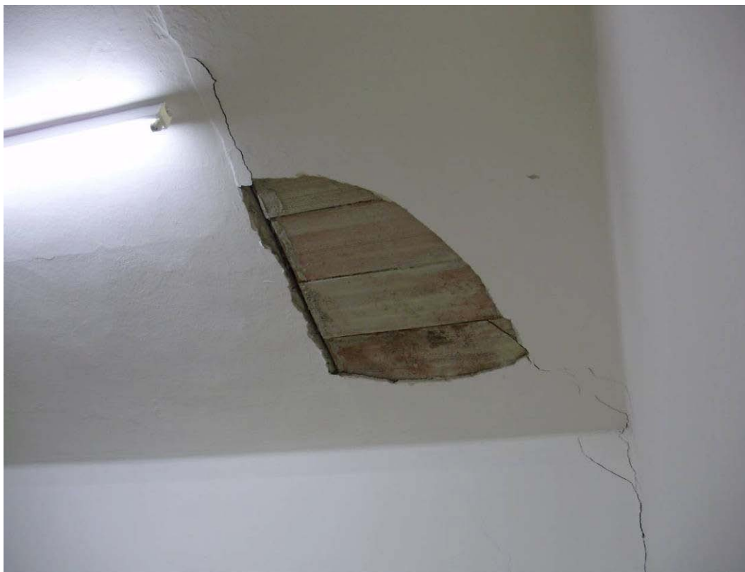
(3.1.1 F) Solaio in putrelle e tavelloni con intonaco distaccato; il tavellone è fuoriuscito dall'appoggio