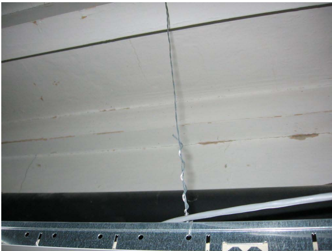
(3.1.3 F) I pendini non appaiono idonei a sostenere il controsoffitto relativamente pesante