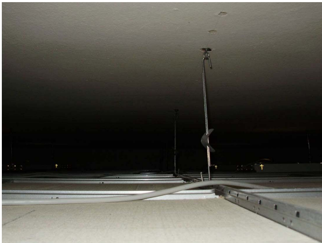
(3.1.3 V) I pendini appaiono idonei a sostenere il controsoffitto leggero e sono in buono stato di conservazione