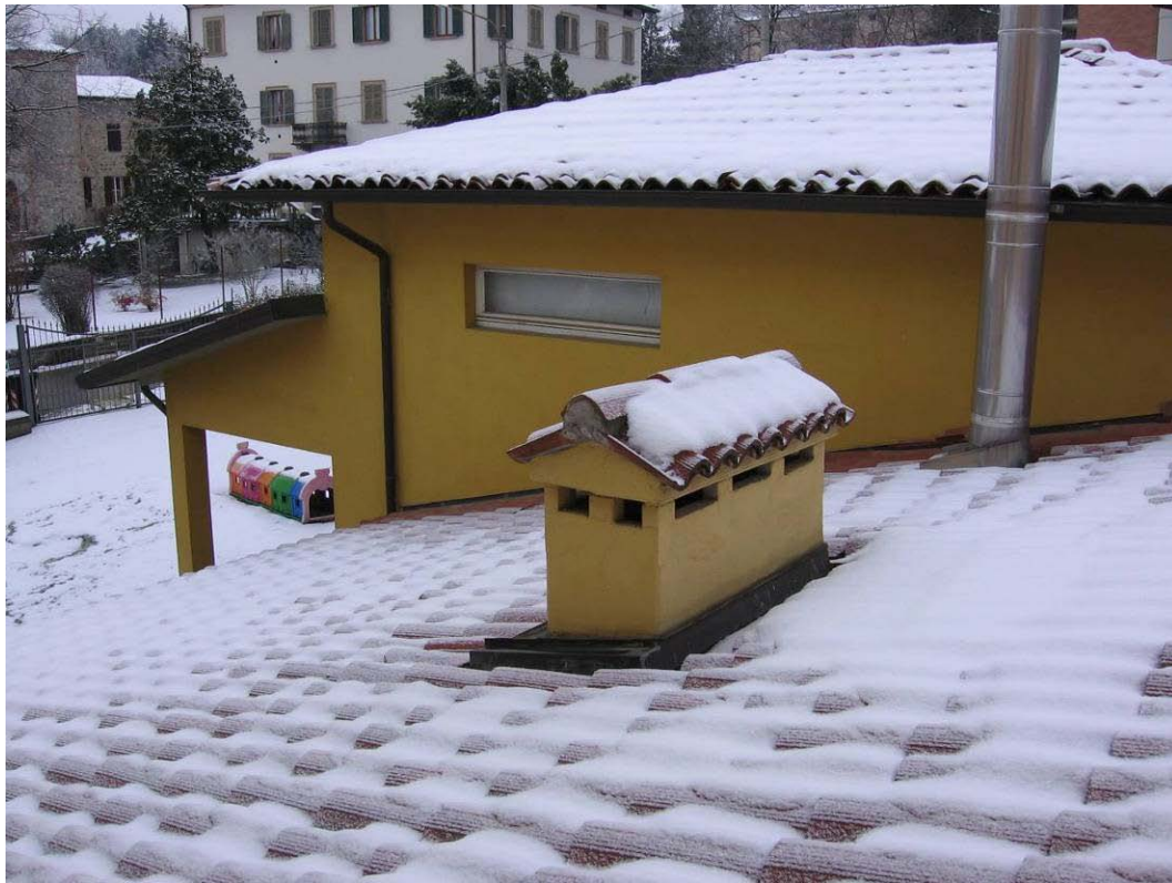
(3.2.3 V) Camino tozzo in muratura