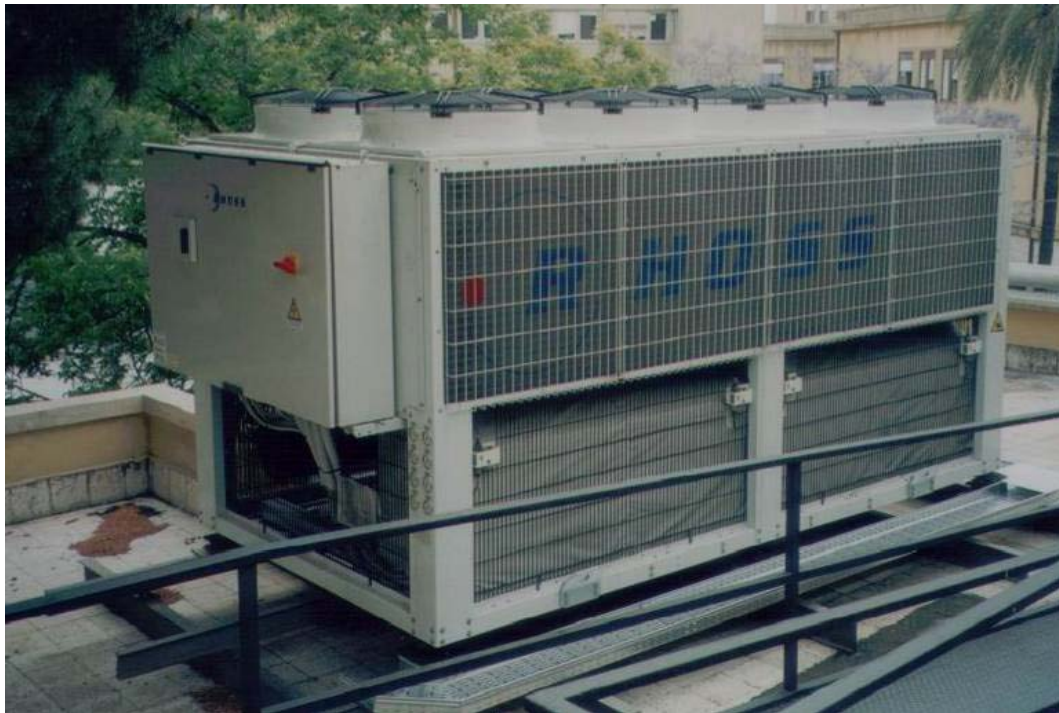
(3.5.3 F) Unità trattamento aria in copertura semplicemente appoggiata sul pavimento