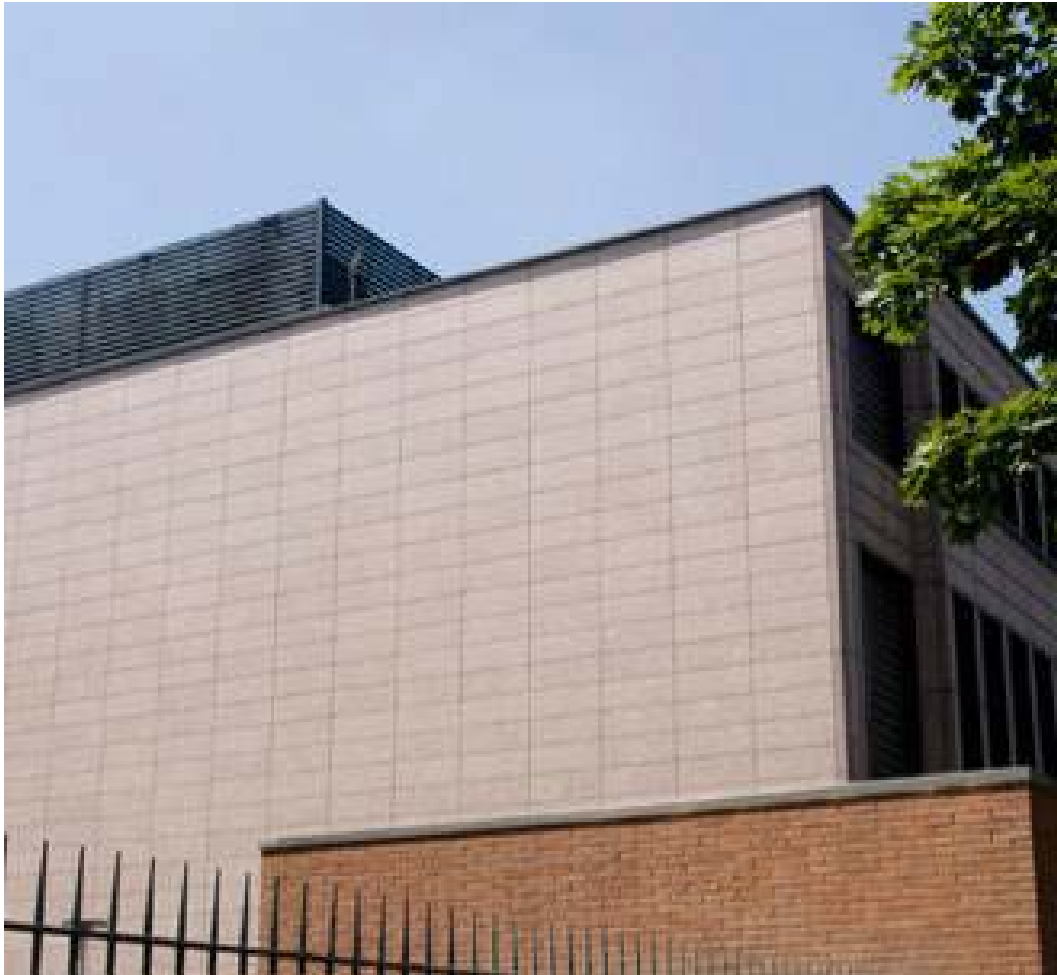
(3.4.2 V) Non sono visibili fessure o danneggiamenti negli elementi di rivestimento.