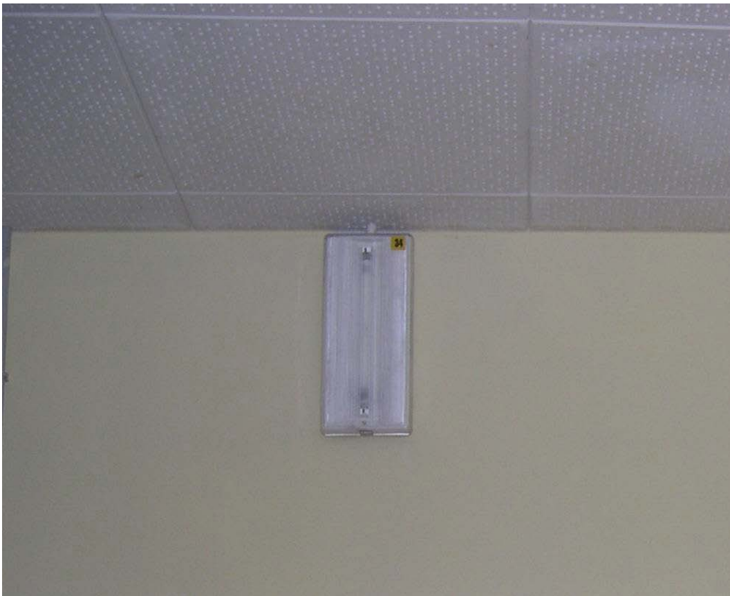
(3.2.5 V) La lampada di emergenza è ben vincolata