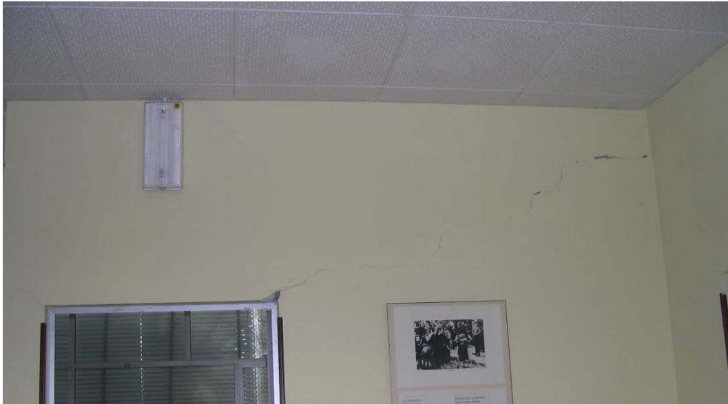
(3.1.2 F) Il controsoffitto non è realizzato con elementi in laterizio, ma comunque con elementi pesanti e fragili (gesso)