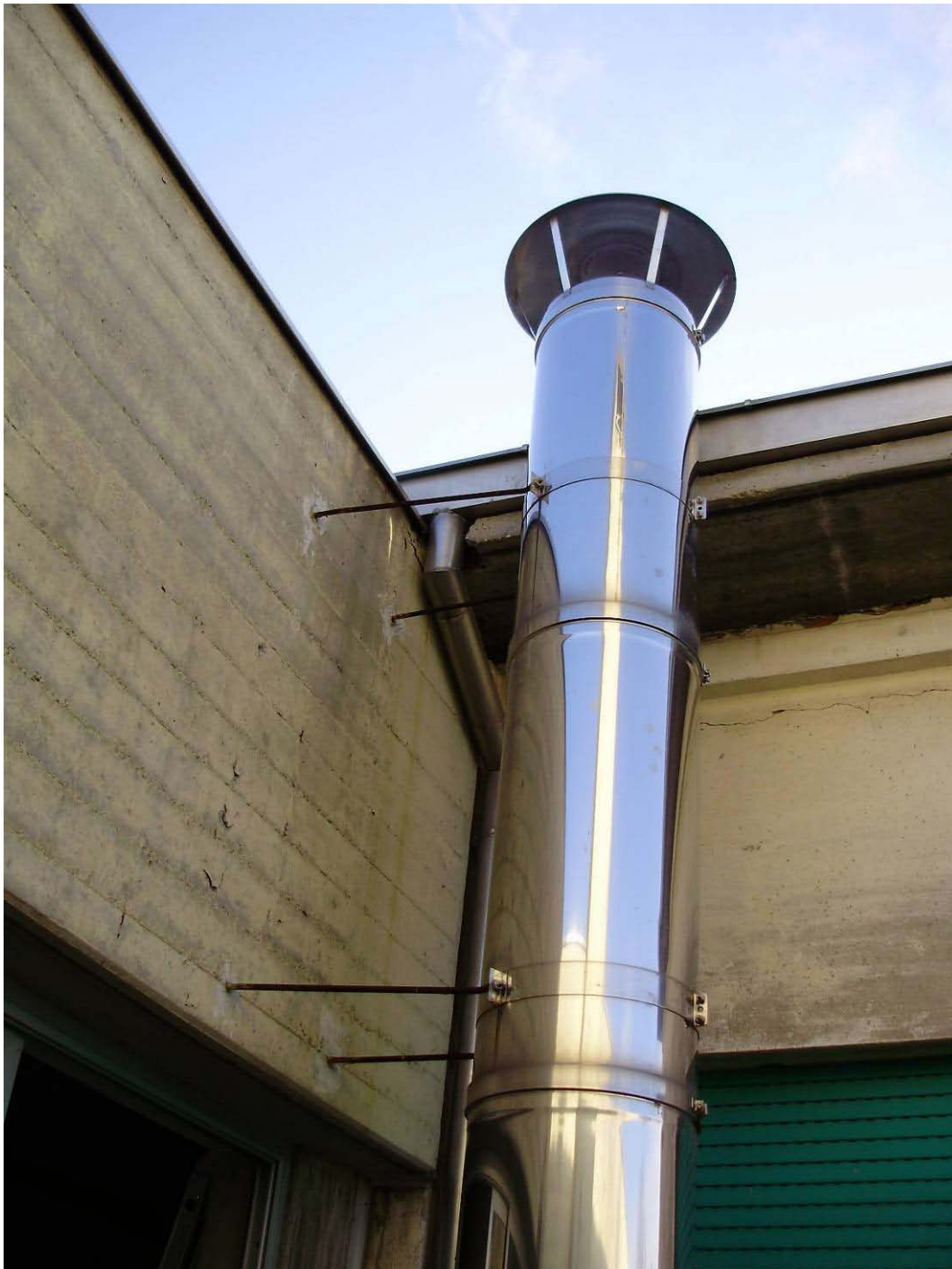
(3.2.3 V) Camino in acciaio ancorato al parapetto in c.a.