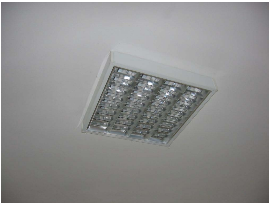
(3.1.1 V) Soffitto intonacato senza segni di degrado e di distacco dell'intonaco