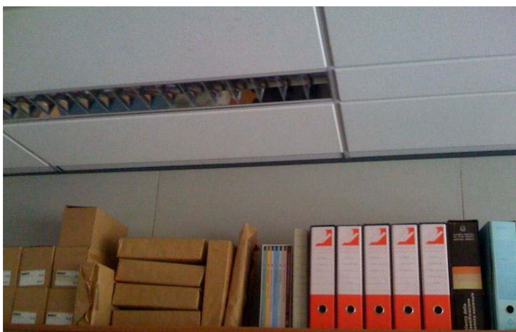
(3.3.2 V) Le partizioni che vanno dal pavimento fino al controsoffitto sono dotate di dispositivi di ritegno (non