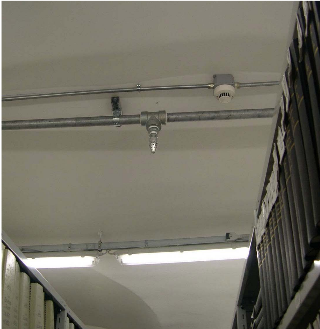
(3.6.1 V) Gli elementi di sostegno delle tubature del sistema antincendio appaiono adeguatamente ancorati