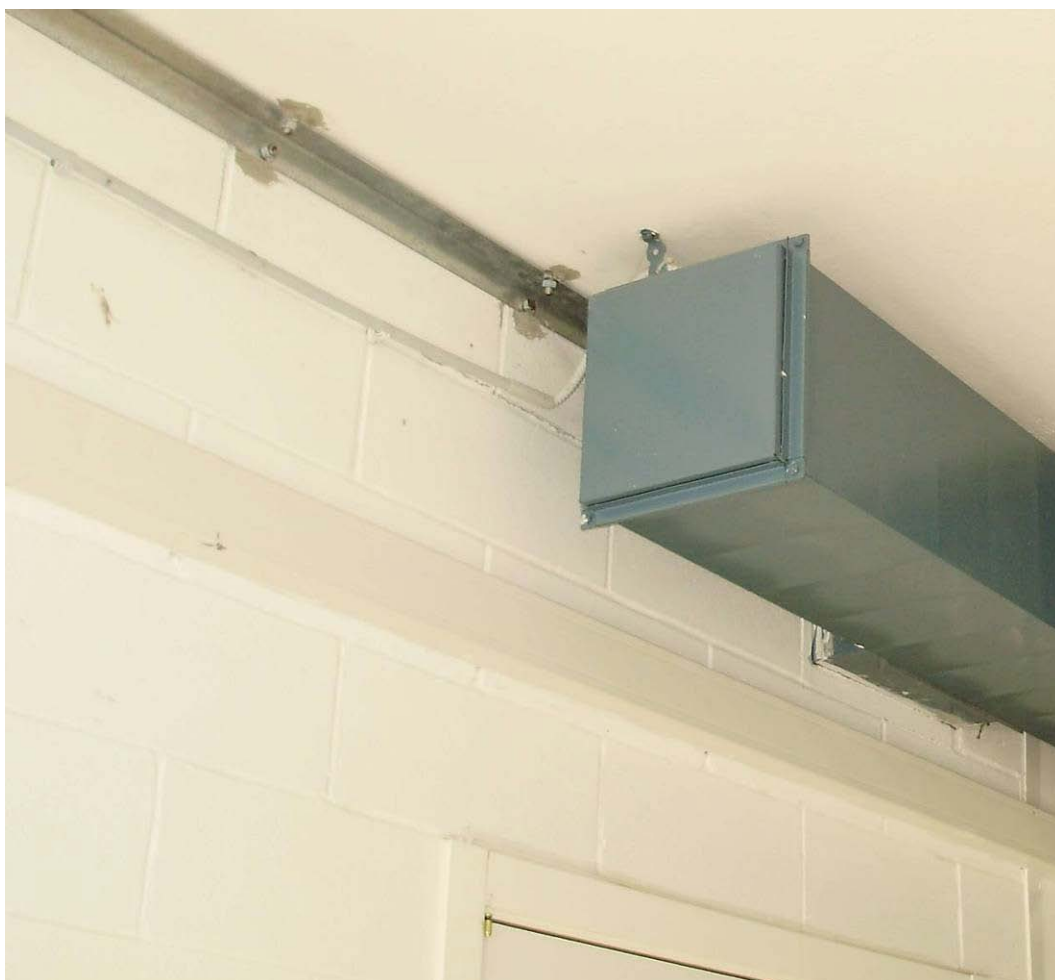
(3.3.1 V) le partizioni interne appaiono ben connesse alla struttura attraverso profili ad L ancorati al solaio