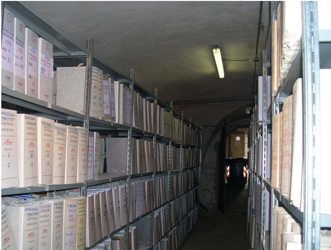
(3.5.1 F) Scaffalature alte e snelle non ancorate adeguatamente alle pareti