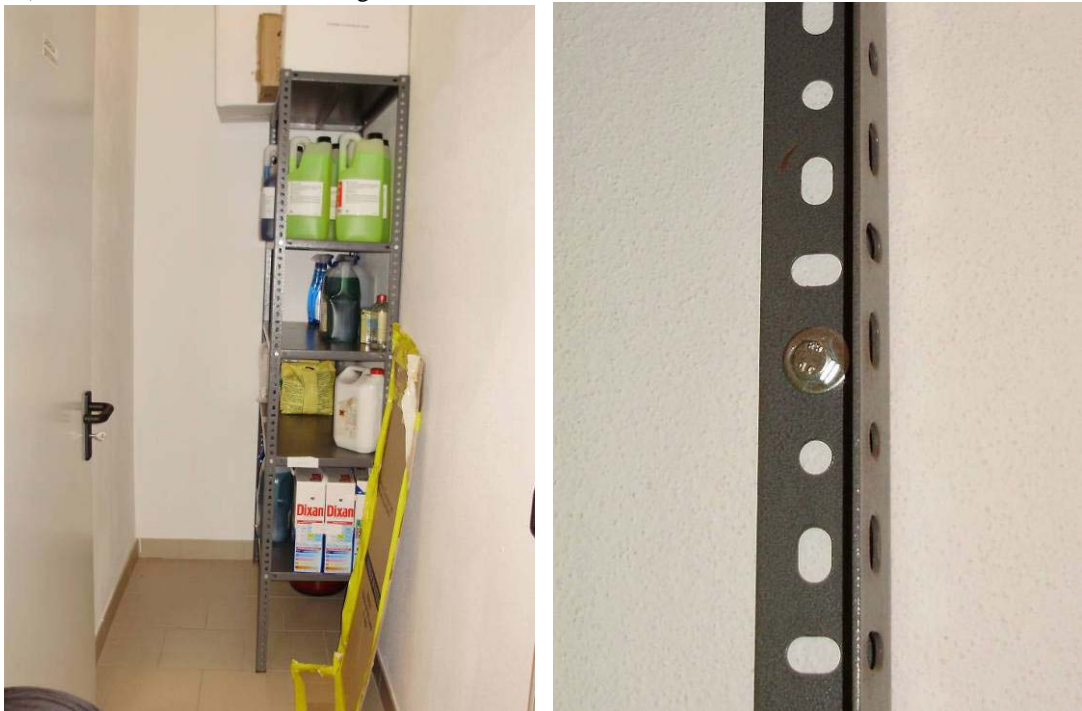
(3.5.1 V) Una scaffalatura alta e snella è efficacemente ancorata alla parete mediante tasselli (foto a destra)