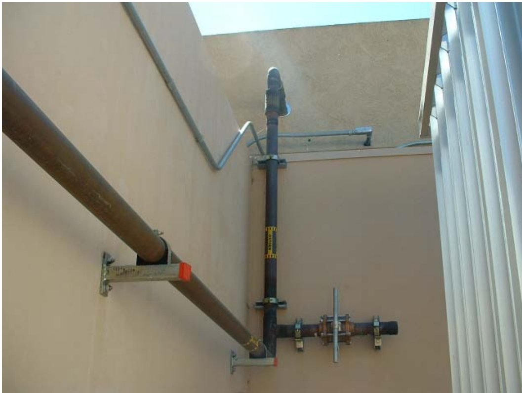
(3.6.2 V) Le tubature del gas e di altri combustibili appaiono adeguatamente ancorate