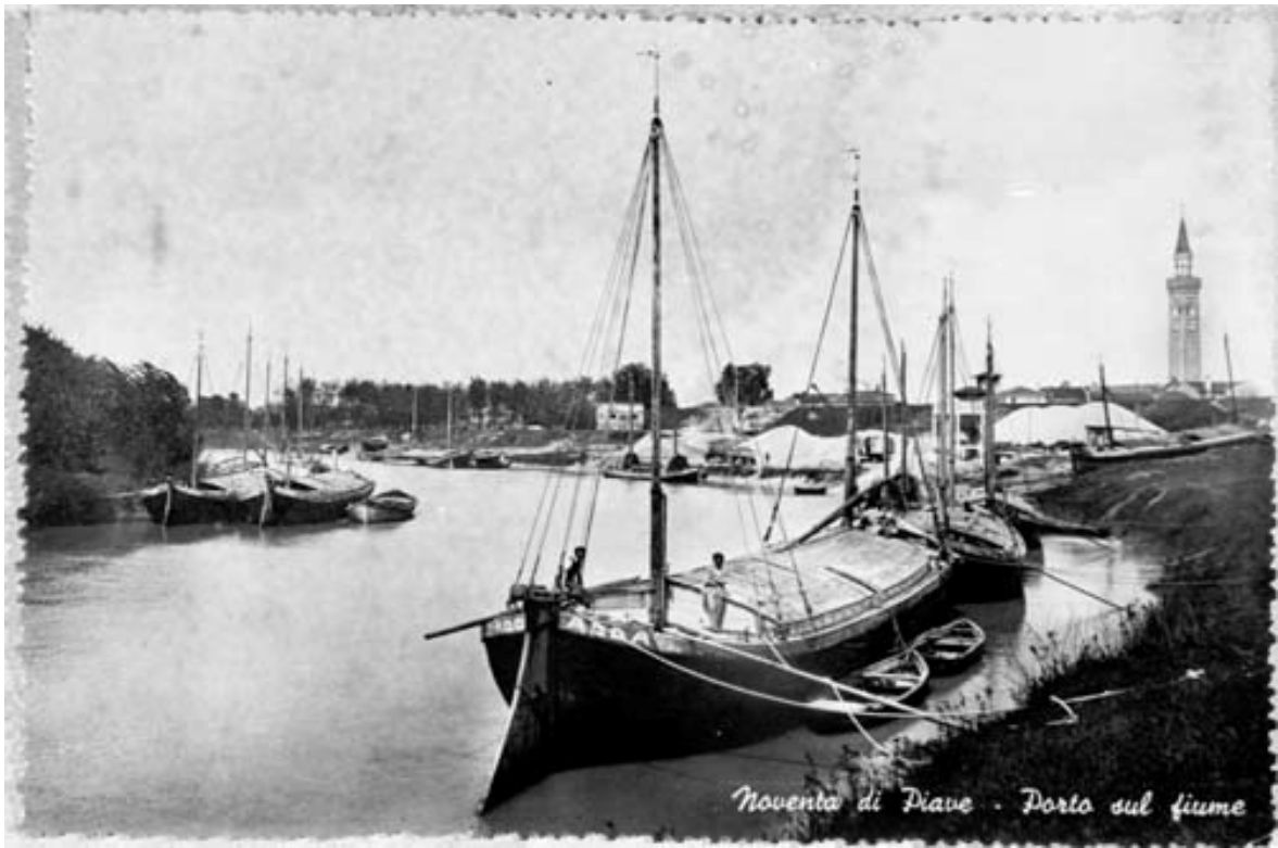
Noventa di Piave - Porto sul fiume