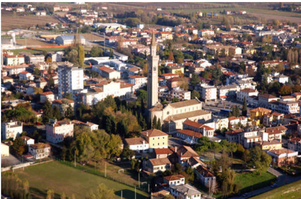
Foto aeree panoramiche