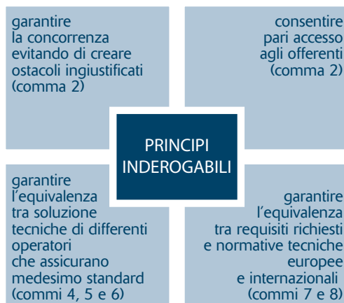
Tabella 1 (art. 68, commi 2, 4, 5, 6, 7, 8)

In tal caso il richiamo ai prodotti ha funzione meramente descrittiva e non costituisce fattore discriminante per la valutazione delle offerte (Cons. St., Sez. VI, 12 novembre 2009, n. 6997).