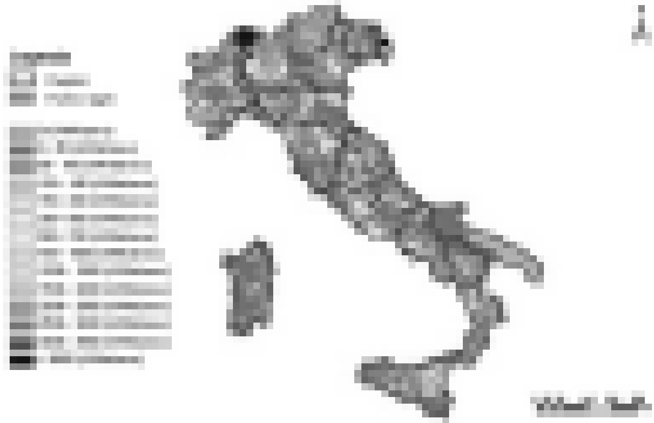
Figura 1 - Mappa del massimo potenziale idroelettrico