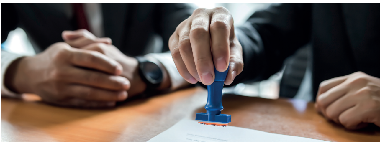
TABELLA RIEPILOGATIVA REQUISITI MINIMI S.O.A

Al fine di offrire un pratico prospetto riepilogativo, proponiamo due Tabelle di sintesi di tutti i requisiti minimi previsti per legge, necessari per conseguire l'Attestazione di Qualificazione S.O.A. qui calcolati sulla base di una sola Categoria.