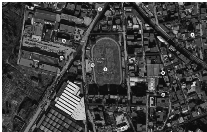
Figura 10.1. Ortofoto

La struttura in oggetto ha una superficie lorda in pianta di circa 21.600 m 2 e può ospitare fino a 1967 spettatori.