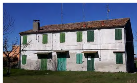
Via Nugarazza 13-15-17 – Ro Ferrarese (FE)