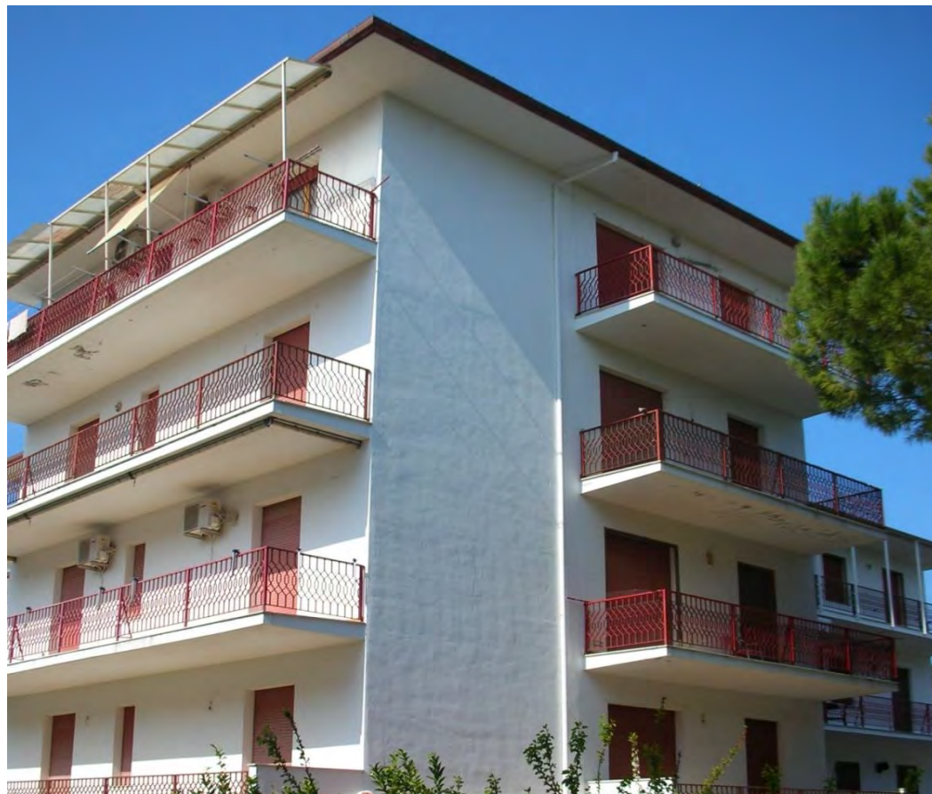
Contrada Ramitelli, snc – Campomarino (CB)