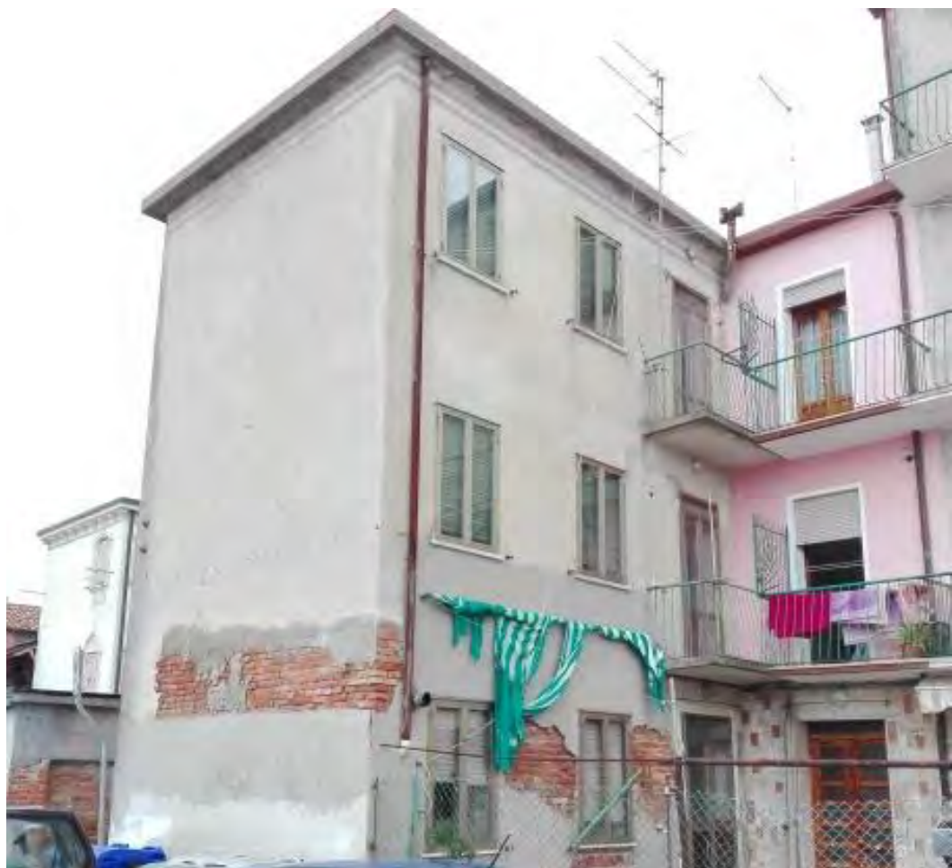
Lungomare Lusenzo, via San Felice 549/C – Chioggia (VE)