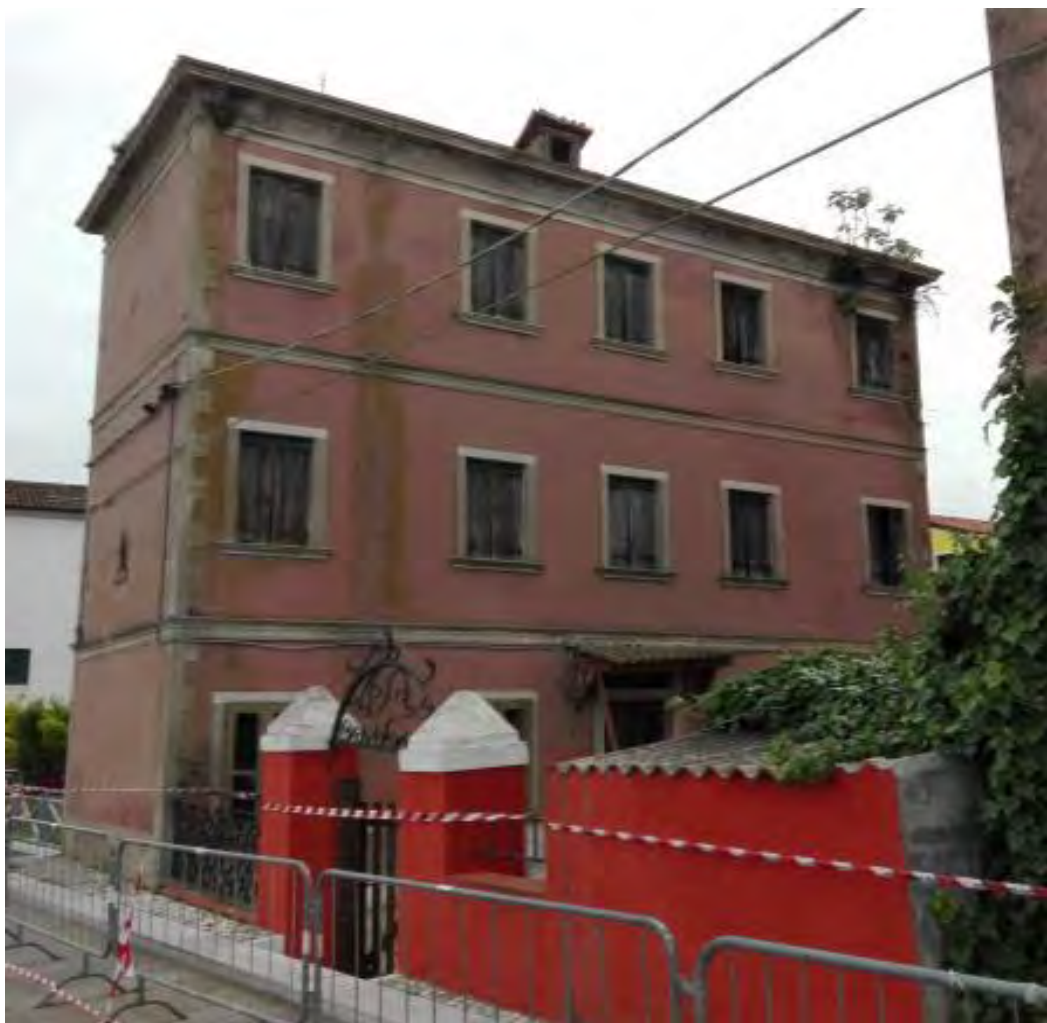
Lungomare Lusenzo – Via Foxia n. 2031 Chioggia (VE)