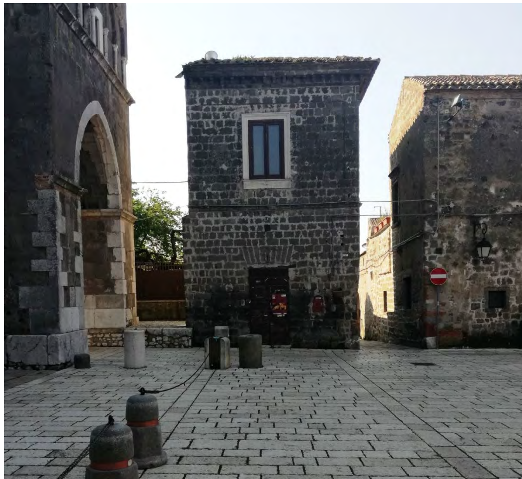
Piazza del Vescovado, località Casertavecchia – Caserta