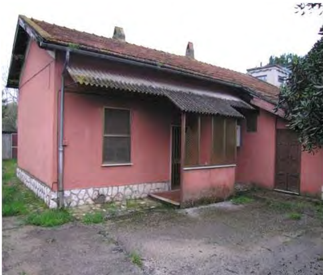
Via del Mare - Località Borgo Grappa - Latina (LT)