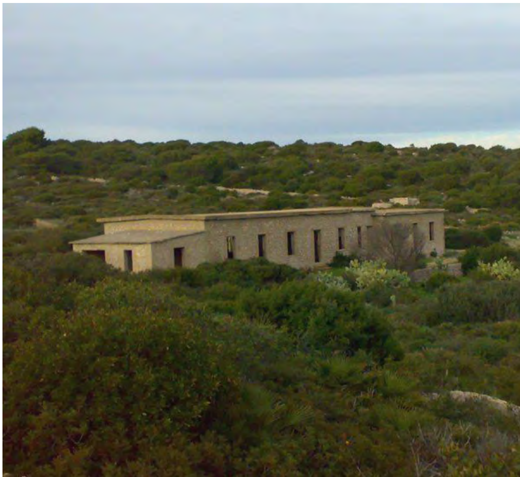
Località Punta Giglio – Alghero (SS)