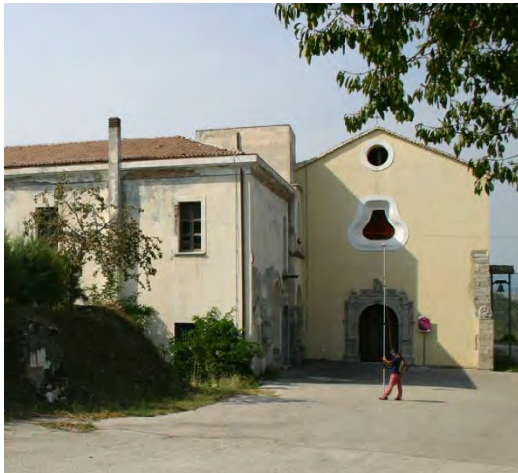
SP 29 snc, Contrada San Marco – Sant'Angelo dei Lombardi (AV)