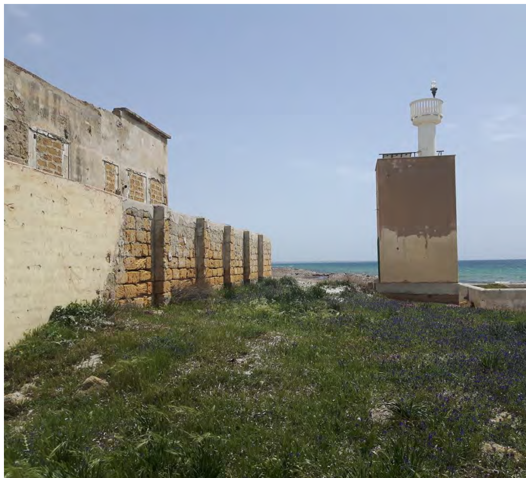
Strada Comunale Spano' snc, Capo Feto – Mazara del Vallo (TP)