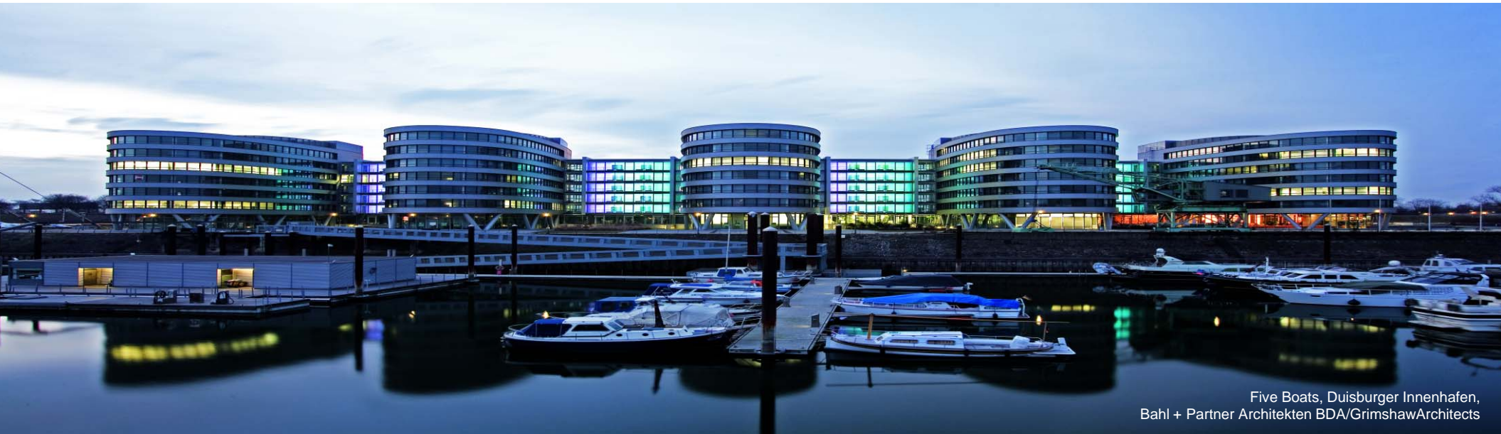
Five Boats, Duisburger Innenhafen, Bahl + Partner Architekten BDA/GrimshawArchitects